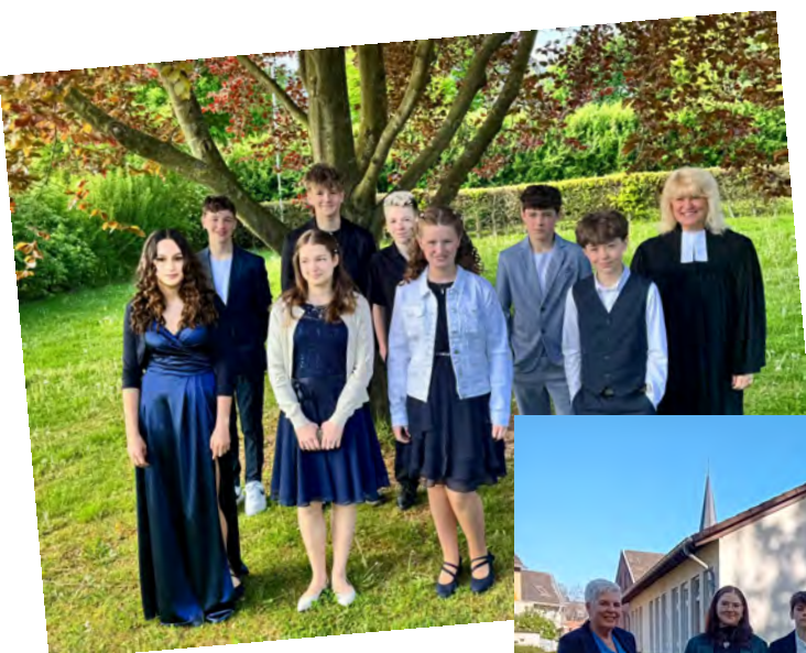
Konfirmation III, Otzenrath

Wir gratulieren allen Konfirmierten ganz herzlich zu diesem wichtigen Schritt und heißen sie in unserer Gemeinde willkommen. Für ihren weiteren Weg wünschen wir ihnen Gottes Segen und viele gute Erfahrungen im Glauben und in der Gemeinschaft.