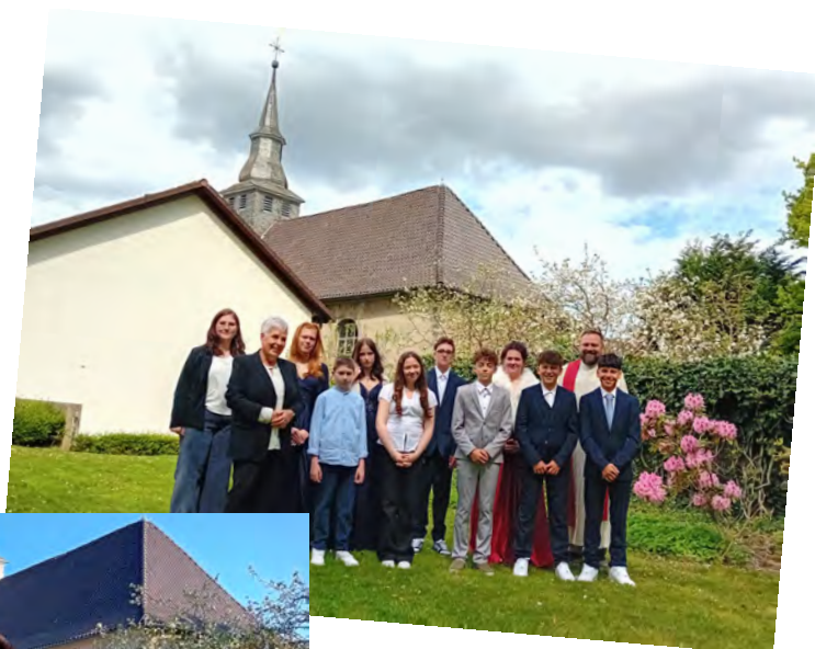
Konfirmation I, Jüchen