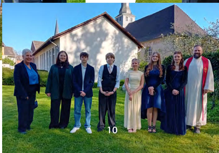
Konfirmation II, Jüchen